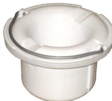
Brage vattenlås RSK: 7118069