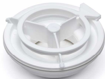
MiniMax50 Nood-lås RSK: 52947

Vid längre resa, då det finns risk att vattenlåset torkar ut, rekommenderas att hålla i ex matolja som avdunstar saktare.